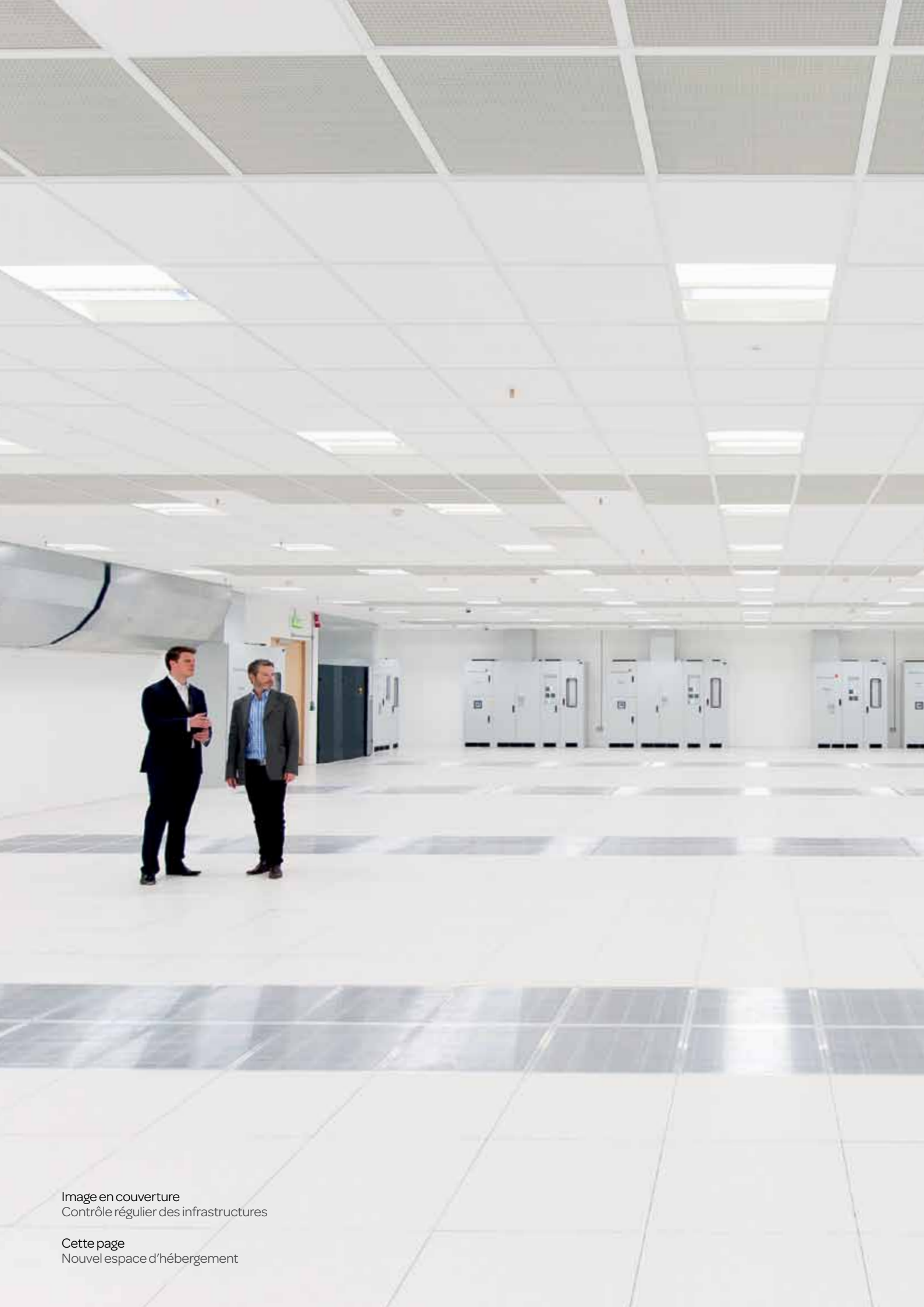
Image en couverture Contrôle régulier des infrastructures