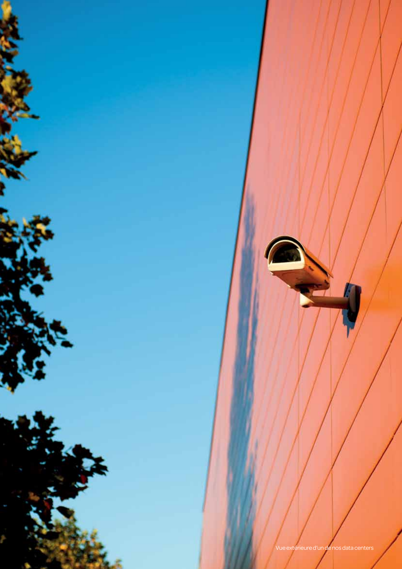
Vue extérieure d'un de nos data centers